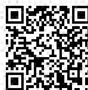
Richieste di inserimento in classifica