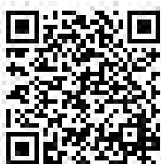
Modulo di protesta

Avviso: L'Albo Ufficiale dei Comunicati (AUC) rappresenta la sola fonte ufficiale di informazioni per questa regata.